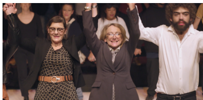
Photogrammes Persona